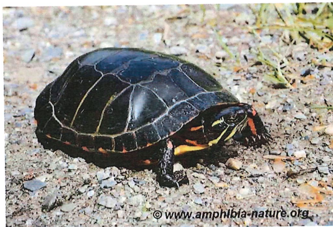
Une tortue peinte adulte observée sur le bord d'un chemin de gravier.

Vous pouvez signaler vos observations à Amphibia-Nature qui confirmera l'identification de l'espèce et pourra répondre à vos questions. Tout signalement, récent ou passé, est pertinent s'il est accompagné d'une photo, d'une date et d'un lieu d'observation. Ces données permettront d'accroître nos connaissances sur la répartition des espèces et seront utiles à des fins de conservation des habitats et de sensibilisation du public.